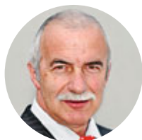
Markus Wäfler, alt Nationalrat EDU ZH

Am 25. September 2022 stimmen wir über das Reformpaket AHV 21 ab. Dazu gehören eine Änderung des Bundesgesetzes über die AHV und der Bundesbeschluss über die Zusatzfinanzierung der AHV durch eine Erhöhung der Mehrwertsteuer um 0,4%. Für die Inkraftsetzung der AHV-Reform 21 ist die Annahme beider Vorlagen nötig. Mit einer Annahme wird die AHV-Finanzierung für die nächsten ca. 10 Jahre gesichert.